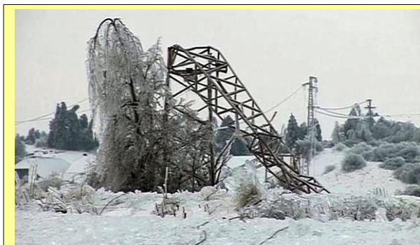
Последствия ледяного дождя в Словении

31 января Словения оказалась в эпицентре циклона, принёсшего с собой сильные морозы, метели, снег и гололедицу. Лёд, снег и падающие деревья вызвали разрушение линий электропередач и перебои с подачей электроэнергии. В ледяной блокаде оказалось более 250 тысяч человек. Быстрое восстановление электроснабжения оказалось затруднено продолжающейся непогодой. Это побудило Словению обратиться с просьбой о помощи к Европейскому Союзу. Были запрошены мобильные электрогенераторы мощностью 100-300 кВА.