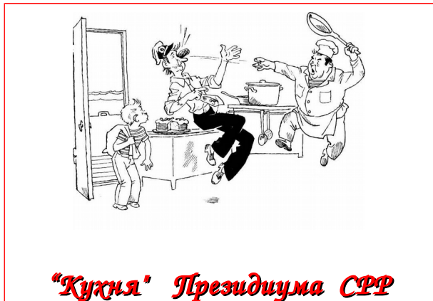
"Кухня" Президиума СРР