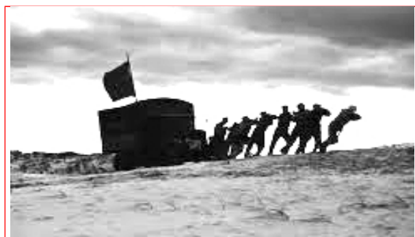
Будни региональных отделений