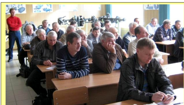
Делегаты и гости конференции слушают отчётный доклад

16 февраля 2014 года состоялась отчетно-выборная конференция РО СРР по Ставропольскому краю. На конференцию были избраны и приняли в ней участие 18 делегатов, представляющих 180 членов РО СРР из 269 членов СРР, состоящих на учёте в региональном отделении, что